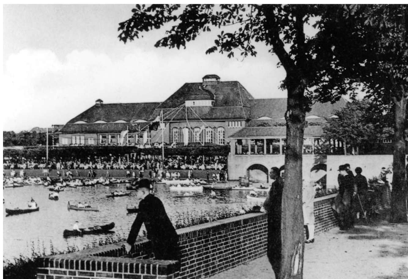
Postkarte um 1930