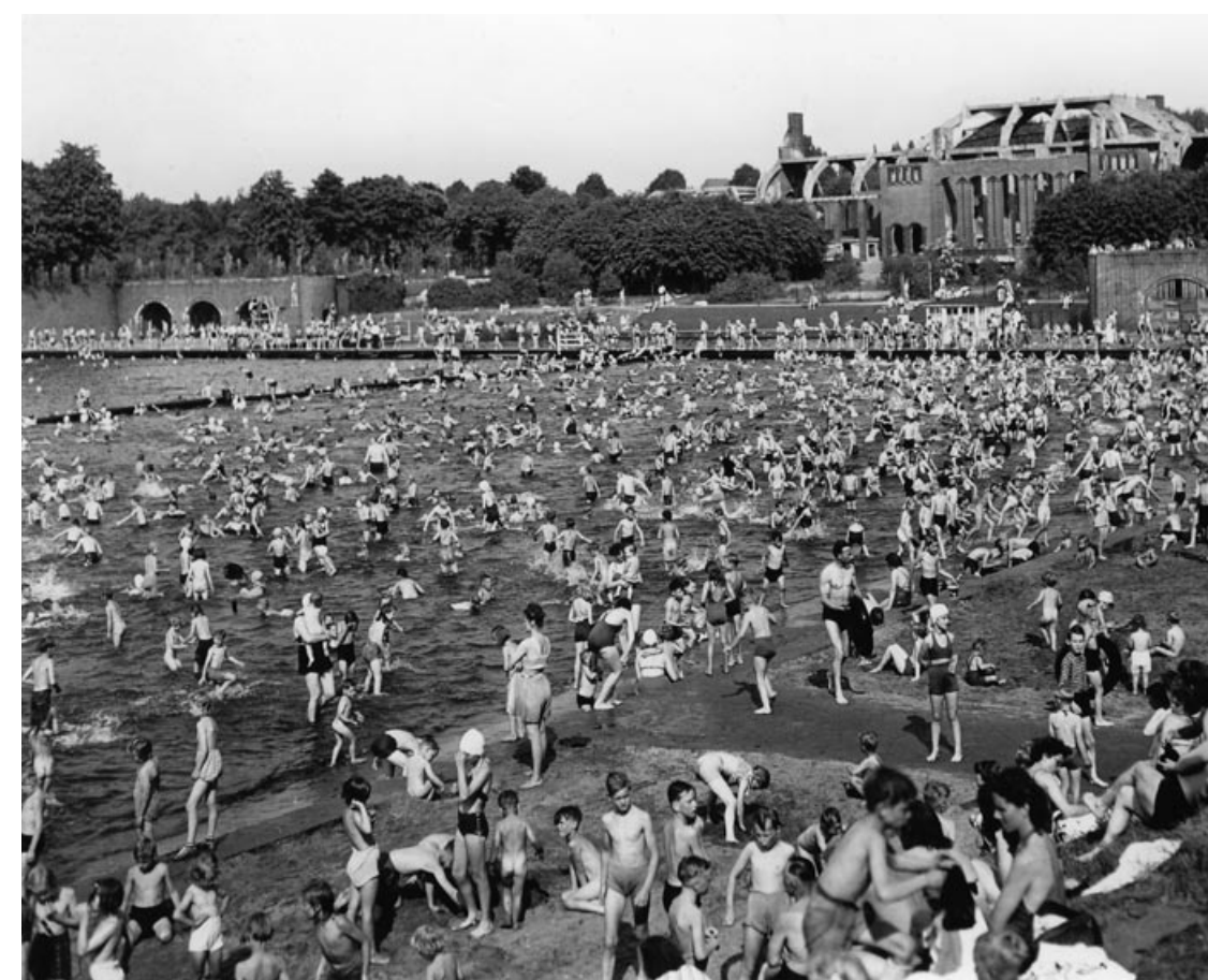
Ruine der Stadthalle mit Freibad um 1950

Die Stadthalle wurde im Juli 1943 durch Bomben schwer beschädigt und um 1951/52 abgerissen. An Stelle des zentralen Mittelbaus entstand das heutige Modellbootbecken. Die Sockel der Säulenhallen und die Treppenanlagen sind noch heute erhalten.